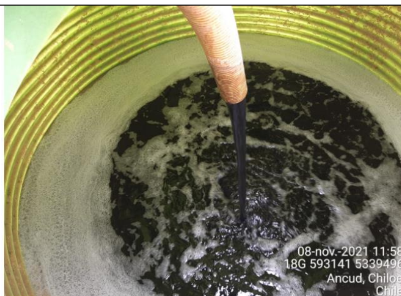
Fotografía N°2: Retiro de Lixiviados a estanque de acumulación por Personal Municipal. Tomada: Lunes 08 de Noviembre del 2021