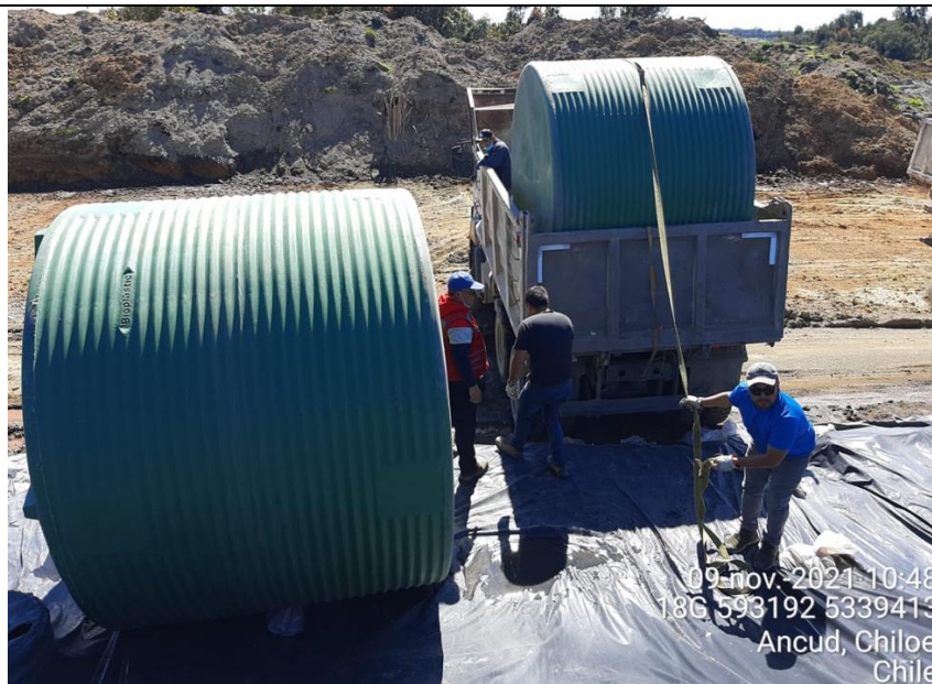
Fotografía N°13: Nuevos Estanques para almacenamiento de Lixiviados.

En cuanto al tema de almacenamiento de lixiviados, dentro de la semana del 08 al 15 de noviembre, se aumentó la capacidad de almacenamiento de lixiviados, aumentando la capacidad de 30 m 3 actual a 120 m 3 . Esto para lograr abarcar más puntos de extracciones desde las cámaras y así bajar aún más los niveles de lixiviados del recinto. Se adjuntan Fotografías de respaldo.