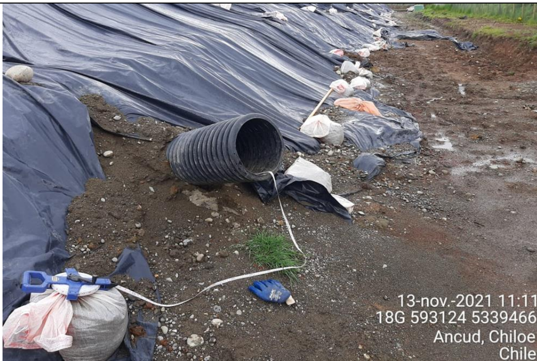
Fotografía N°22: Medición de Niveles de cámaras por Personal Municipal. Tomada: 13 de Noviembre del 2021