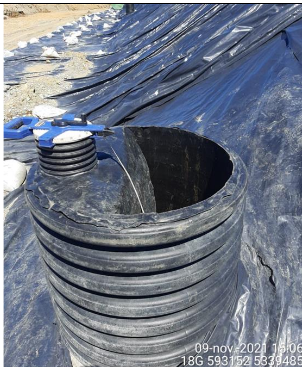
Fotografía N°18: Medición de Niveles de cámaras por Personal Municipal. Tomada: 09 de Noviembre del 2021.