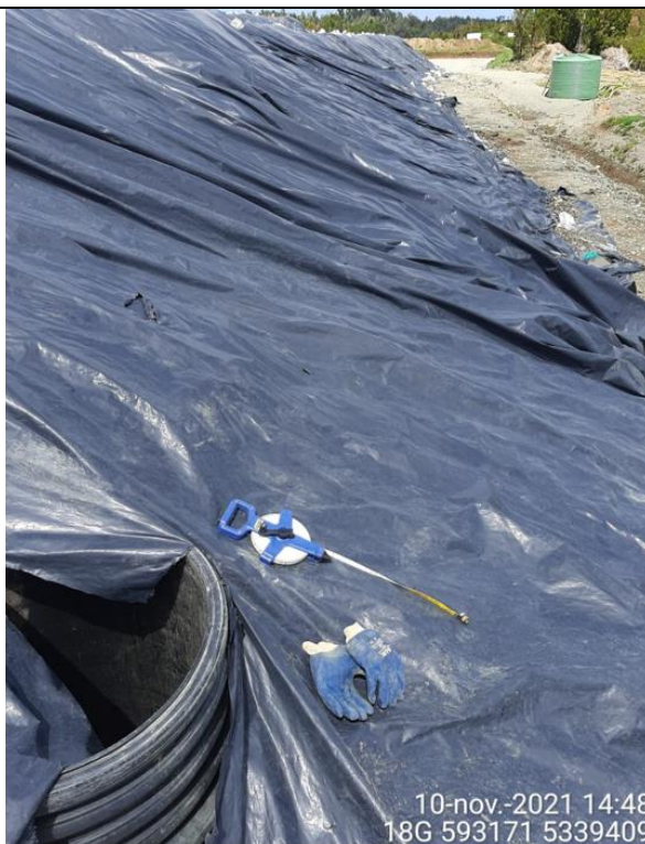
Fotografía N°19: Medición de Niveles de cámaras por Personal Municipal. Tomada: 10 de Noviembre del 2021del 2021.