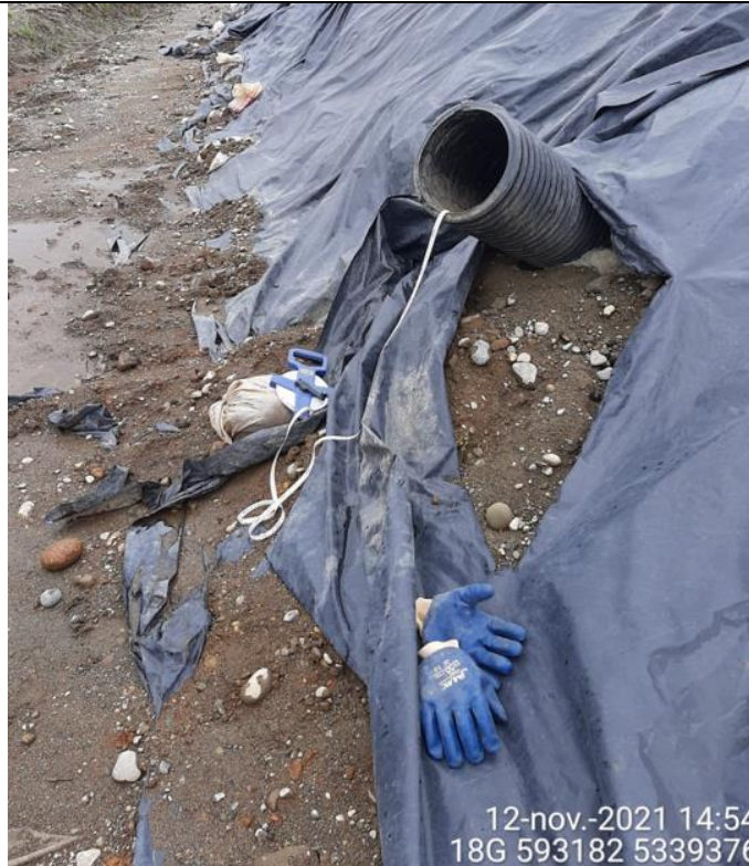
Fotografía N°21: Medición de Niveles de cámaras por Personal Municipal. Tomada: 12 de Noviembre del 2021.