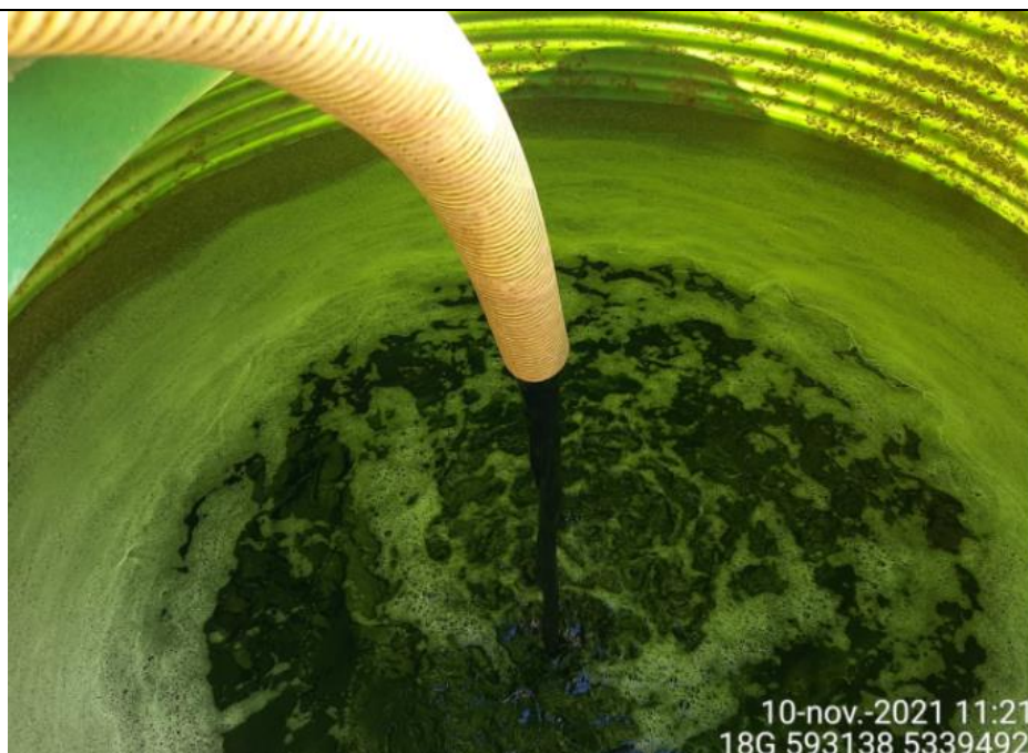
Fotografía N°6: Extracción de Lixiviados desde Cámara C08. Tomada: Miércoles 10 de Noviembre del 2021.