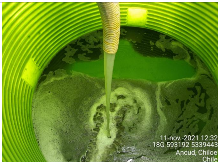
Fotografía N°8: Extracción de Lixiviados a estanque. Tomada: Jueves 11 de Noviembre del 2021.