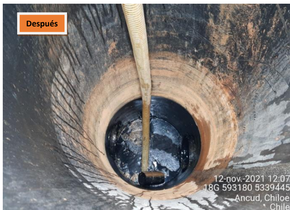
Fotografía N°9: Extracción de Lixiviados en cámara C12 Antes y Después Retiro. Tomada: Viernes 12 de Noviembre del 2021.