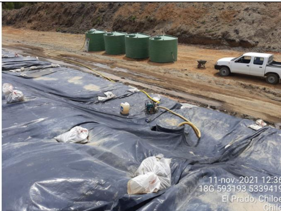
Fotografía N°7: Extracción de Lixiviados C13 por personal Municipal Tomada: Jueves 11 de Noviembre del 2021.