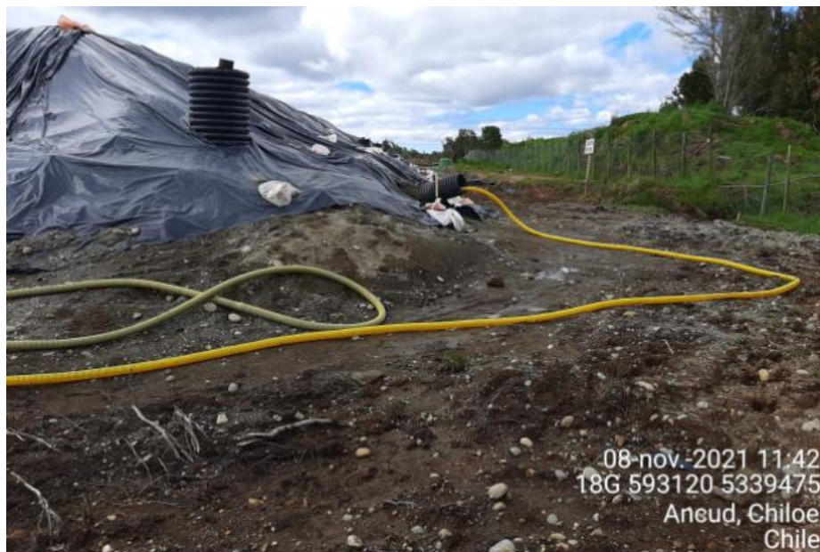
Fotografía N°1: Retiro de Lixiviados desde diagonal D04 por Personal Municipal. Tomada: Lunes 08 de Noviembre del 2021.

Para dar cumplimiento a lo indicado en Res. Exenta N°2291, emitida con fecha 18 de Octubre del 2021. A continuación, se presenta el registro fotográfico de las actividades de extracción de la semana del 08 al 14 de Noviembre del 2021.