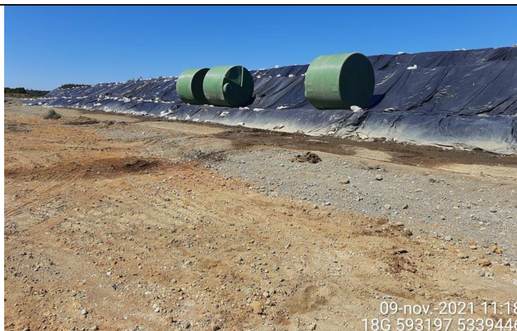
Fotografía N°14: Posicionamiento Nuevos Estanques para almacenamiento de Lixiviados.