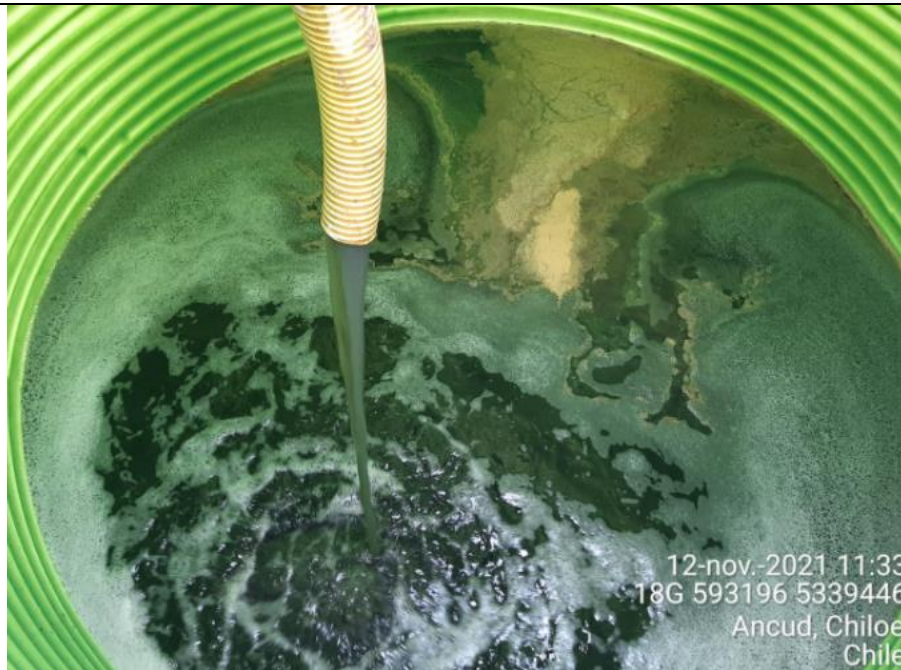
Fotografía N°10: Retiro de Lixiviados a estanque de acumulación. Tomada: Viernes 12 de Noviembre del 2021.