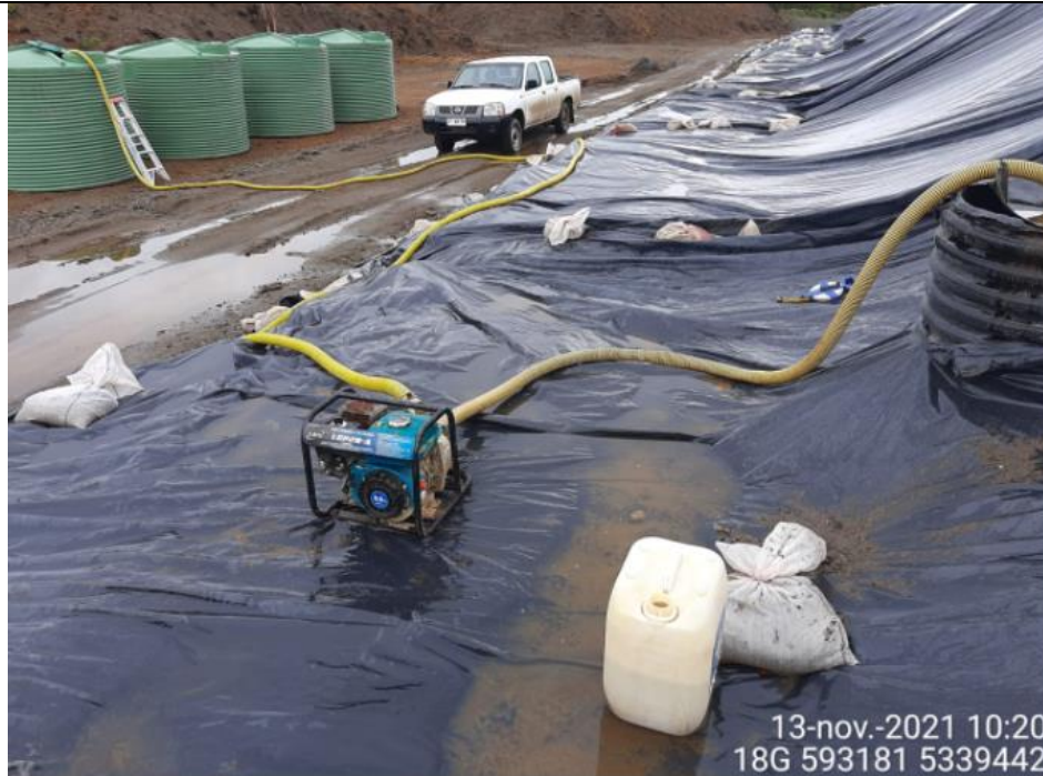
Fotografía N°11: Extracción de Lixiviados desde cámara C12 y C13. Tomada: Sábado 13 de Noviembre del 2021.