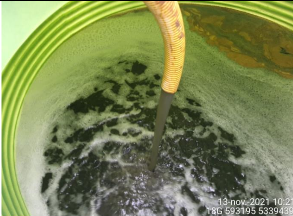
Fotografía N°12: Retiro de Lixiviados a estanque de acumulación. Tomada: Sábado 13 de Noviembre del 2021.

Respecto a los retiros de lixiviados se mencionan en la siguiente tabla el cronograma y Cantidad de lixiviados retirados por jornada correspondiente del 08 al 14 de Noviembre del 2021.