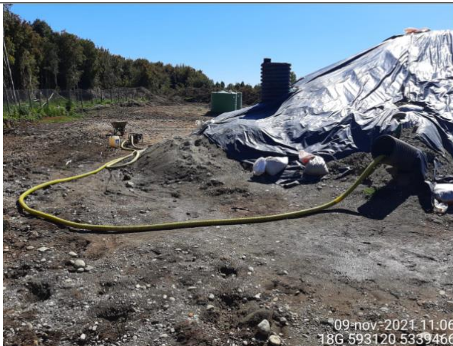
Fotografía N°3: Retiro de Lixiviados desde diagonal D04 por Personal Municipal. Tomada: Martes 09 de Noviembre del 2021.