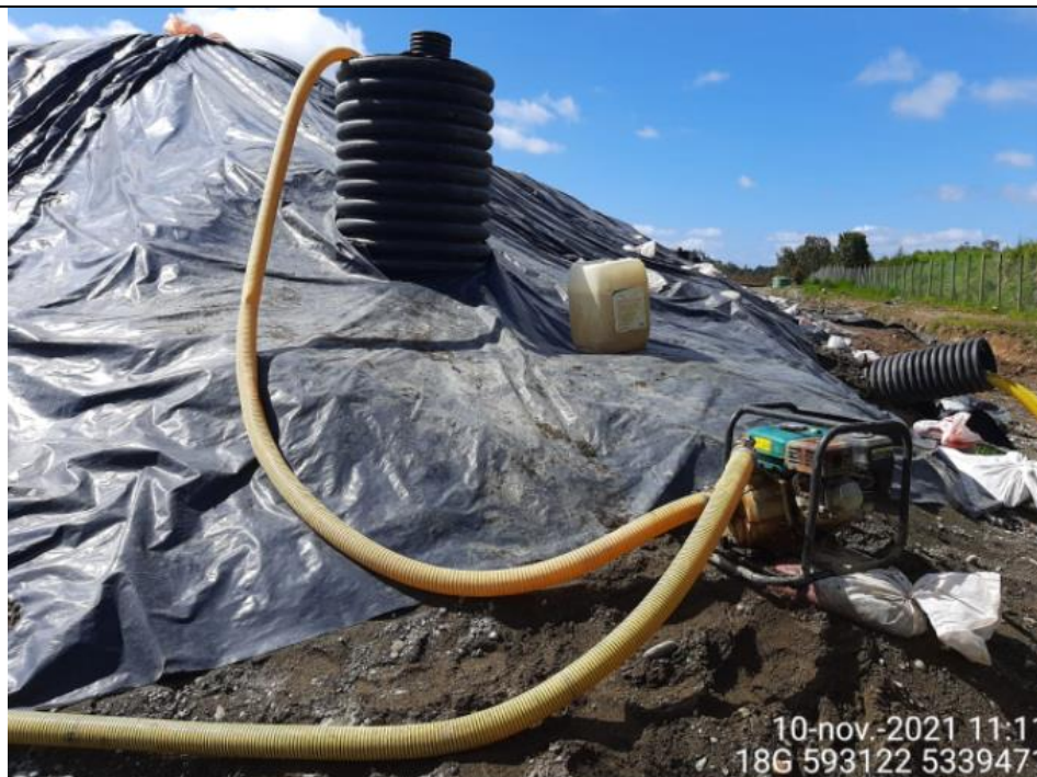
Fotografía N°5: Extracción de Lixiviados desde Cámara C08. Tomada: Miércoles 10 de Noviembre del 2021.