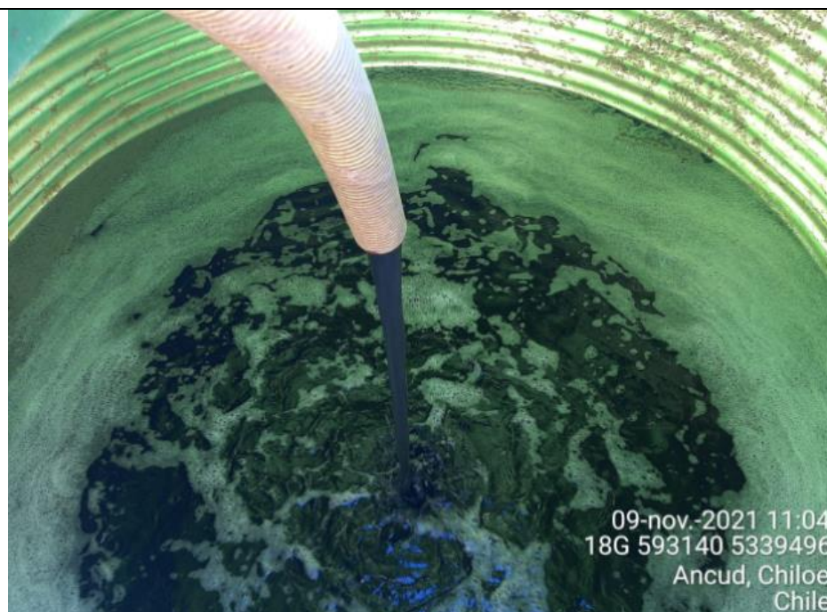
Fotografía N°4: Retiro de Lixiviados desde diagonal D04 por Personal Municipal. Tomada: Martes 09 de Noviembre del 2021.