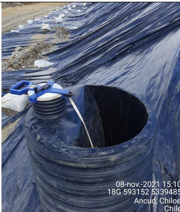
Fotografía N°17: Medición de Niveles de cámaras por Personal Municipal. Tomada: 08 de Noviembre del 2021.