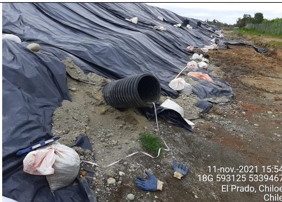
Fotografía N°20: Medición de Niveles de cámaras por Personal Municipal. Tomada: 11 de Noviembre del 2021.